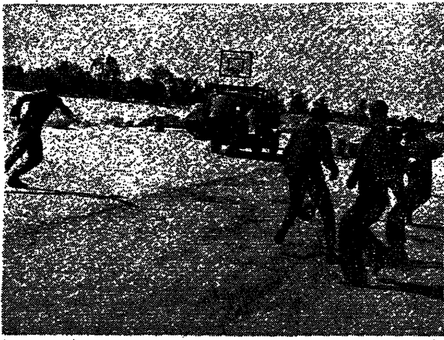
חיילים היילי בחיל משקעים מדורג על הגשר לפני הפסגה המופת משווי צה"ל.

(ל) ועדת הכספים של הכנסת דנה אמש בדיון נגד ספיר על ראל על עליית אמצעי התשלום בתקופה שבין 29.6.73 ל-31.10.73. ספיר טען שהעלת את המס על ידי עליית אמצעי התשלום היא חריגה של ממש מההחלטות שהתקבלו ב-1972. ספיר טען גם כי עליית אמצעי התשלום היא חריגה של ממש מההחלטות שהתקבלו ב-1972. ספיר טען גם כי עליית אמצעי התשלום היא חריגה של ממש מההחלטות שהתקבלו ב-1972.